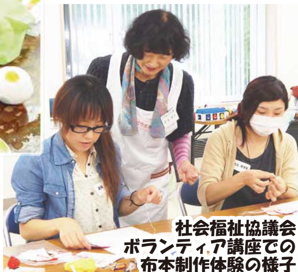
社会福祉協議会ボランティア講座での布本制作体験の様子

喜ばれる仕掛けは、保育士の経験を生かしたり、身近な子どもたちをヒントにしています。これにより、子ども目線のアイデアが生まれます。