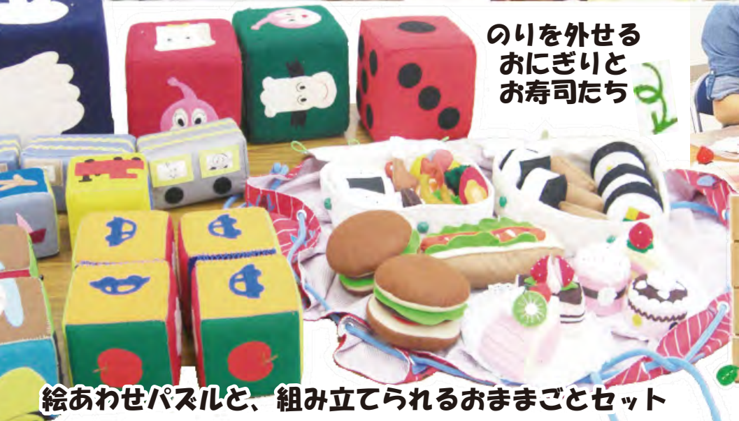
絵あわせパズルと、組み立てられるおままごとセット