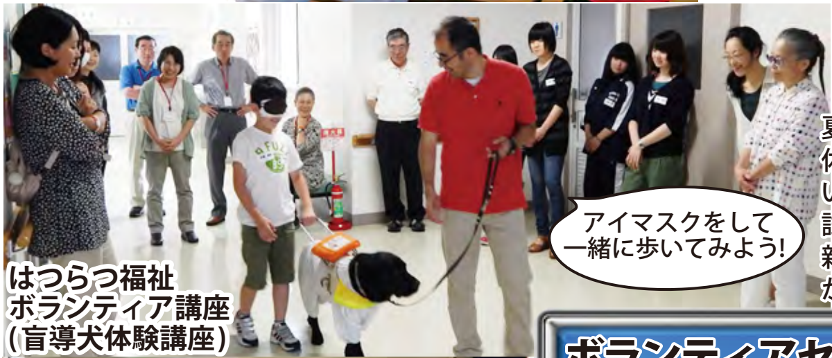
はつらつ福祉 ボランティア講座 (盲導犬体験講座)