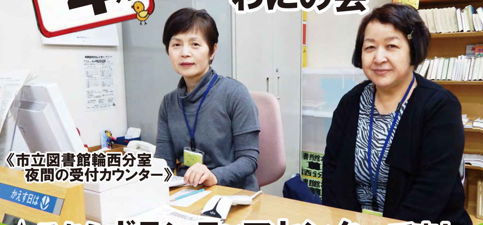
《市立図書館輪西分室 夜間の受付カウンター》