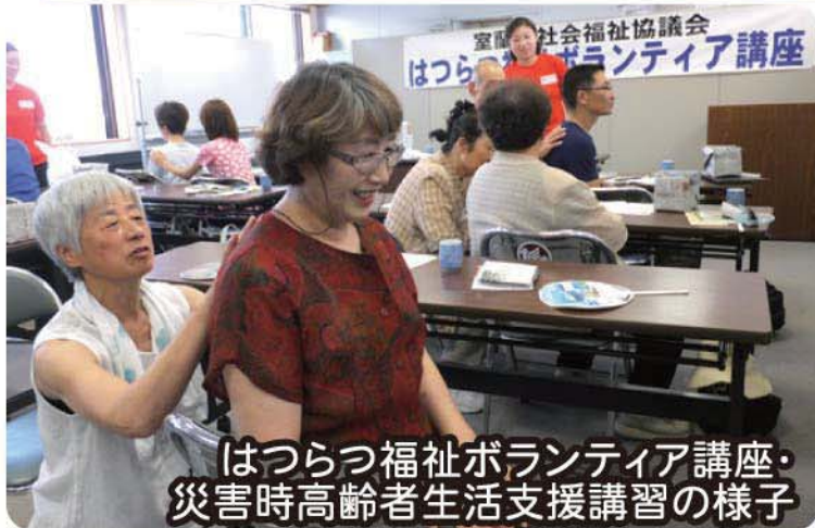
はつらつ福祉ボランティア講座・災害時高齢者生活支援講習の様子