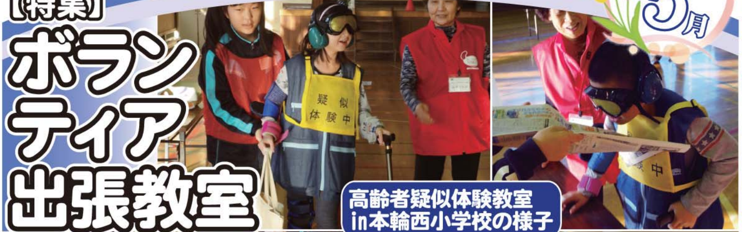
高齢者疑似体験教室 in本輪西小学校の様子