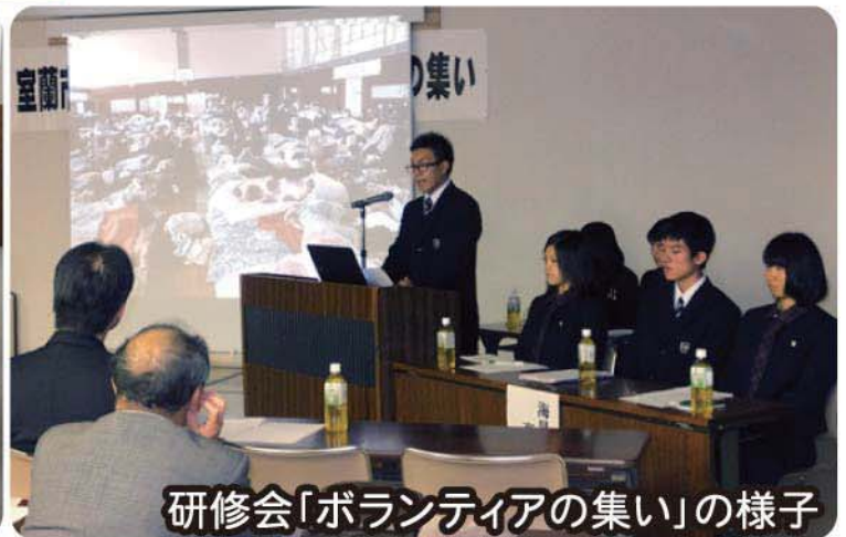
研修会「ボランティアの集い」の様子

多くの方にボランティアを知って、体験してもらうため、今年も講座を開催します! 詳しい内容については、ボランティアだより・広報誌等でお知らせします! ぜひ参加ください!