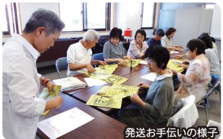
発送お手伝いの様子