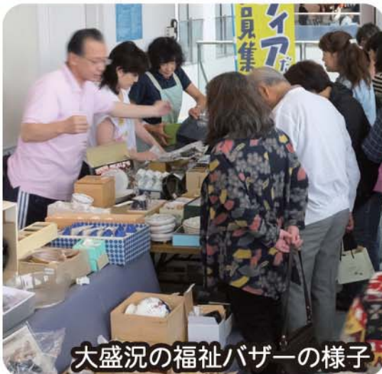
大盛況の福祉バザーの様子