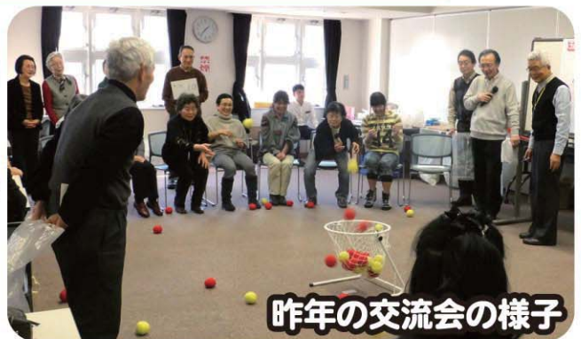
昨年の交流会の様子