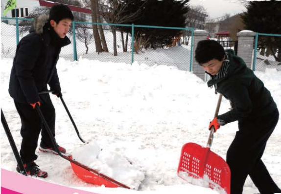
レンジャーに協力してくれたみなさん

ご自身での雪かきが難しい方 お困りさん と、 お手伝いできるボランティアの 雪かきレンジャー を結びつけ、 地域の雪かきをサポートする事業です。 ★登録制 ★詳しくはお問い合わせください