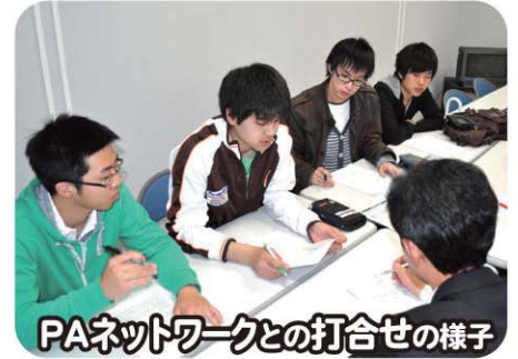
PAネットワークとの打合せの様子

室蘭社協では、市民のみなさんがよりよい暮らしを送っていただくための計画を考えようと、平成22年にアンケートを実施しました。結果、高齢の方の生活支援として雪かきの要望が多く、「室蘭工業大学ボランティアサークルPAネットワーク」と協力し、ボランティアによる雪かき応援のしくみを考えました。