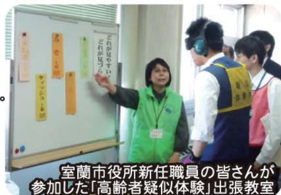
室蘭市役所新任職員の皆さんが参加した「高齢者疑似体験」出張教室