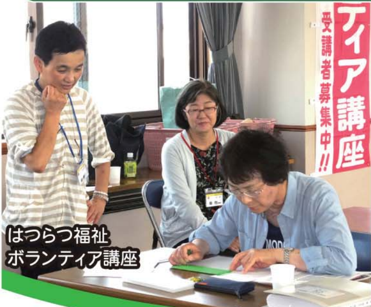
はつらつ福祉 ボランティア講座

ボランティアの募集・紹介、相談の受け付け、 講座の開催・情報発信などを行っています。