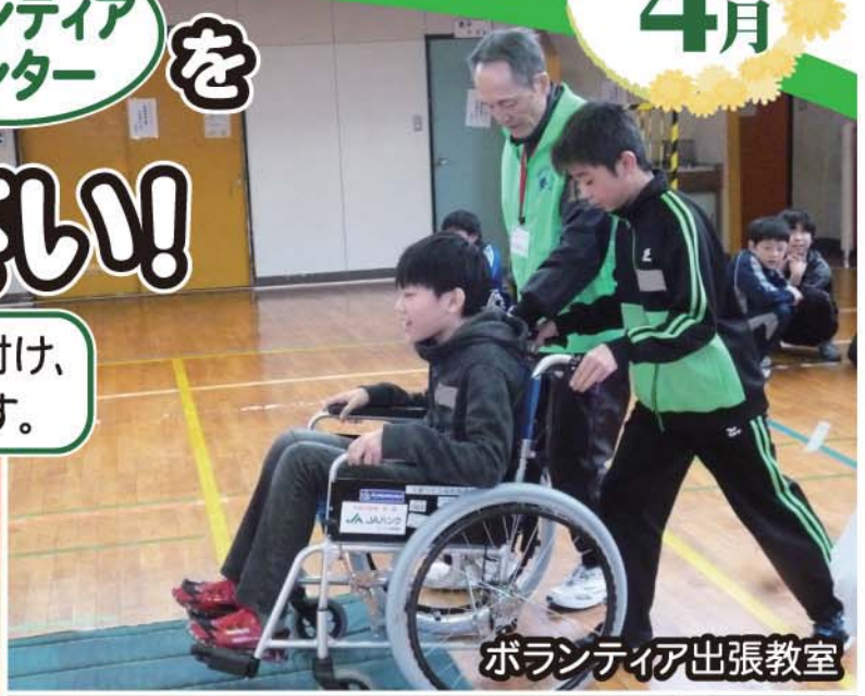
ボランティア出張教室