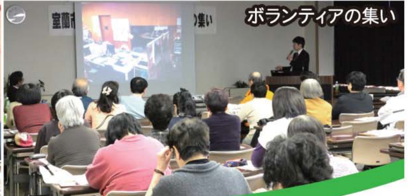
ボランティアの集い