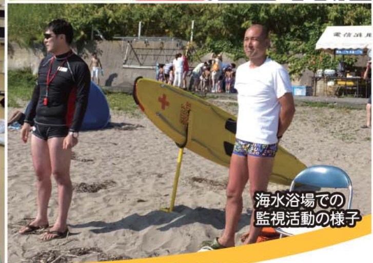
海水浴場での 監視活動の様子