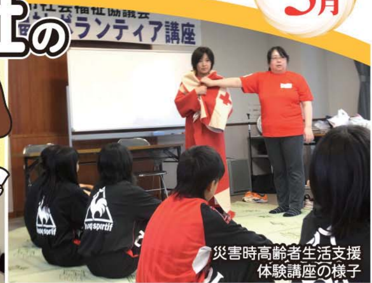
災害時高齢者生活支援 体験講座の様子