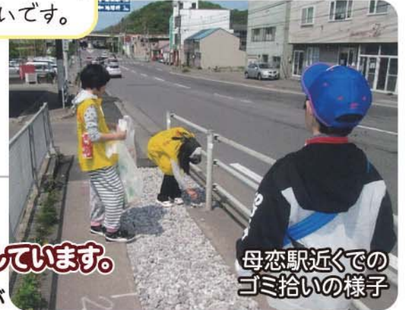
母恋駅近くでのゴミ拾いの様子

ほかにも、福祉施設で踊りや演奏を行ったり、赤い羽根共同募金の呼びかけなどにも協力しています。これらはすべて子どもたちが企画・実行しています。