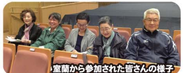
室蘭から参加された皆さんの様子