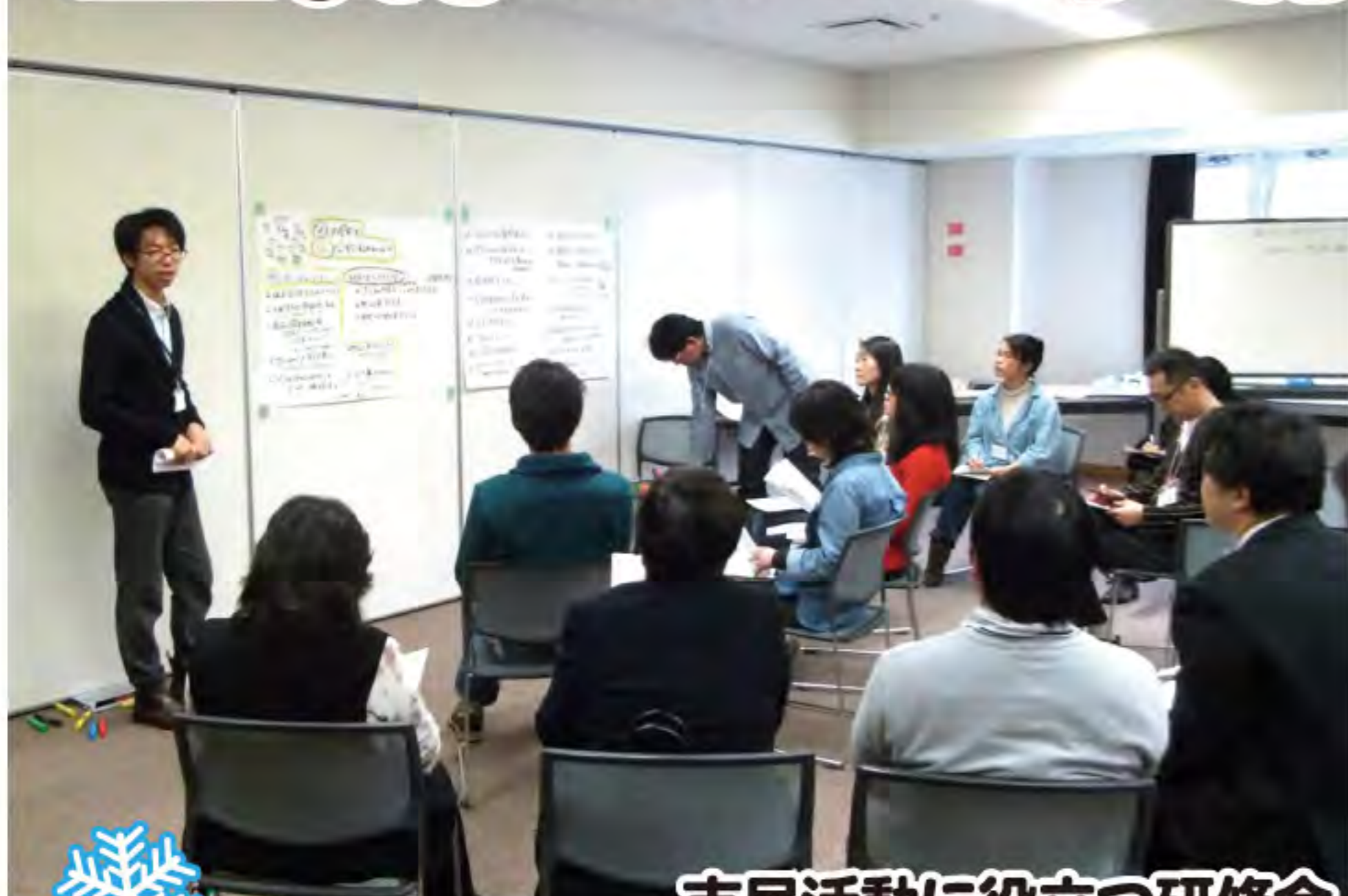
市民活動に役立つ研修会