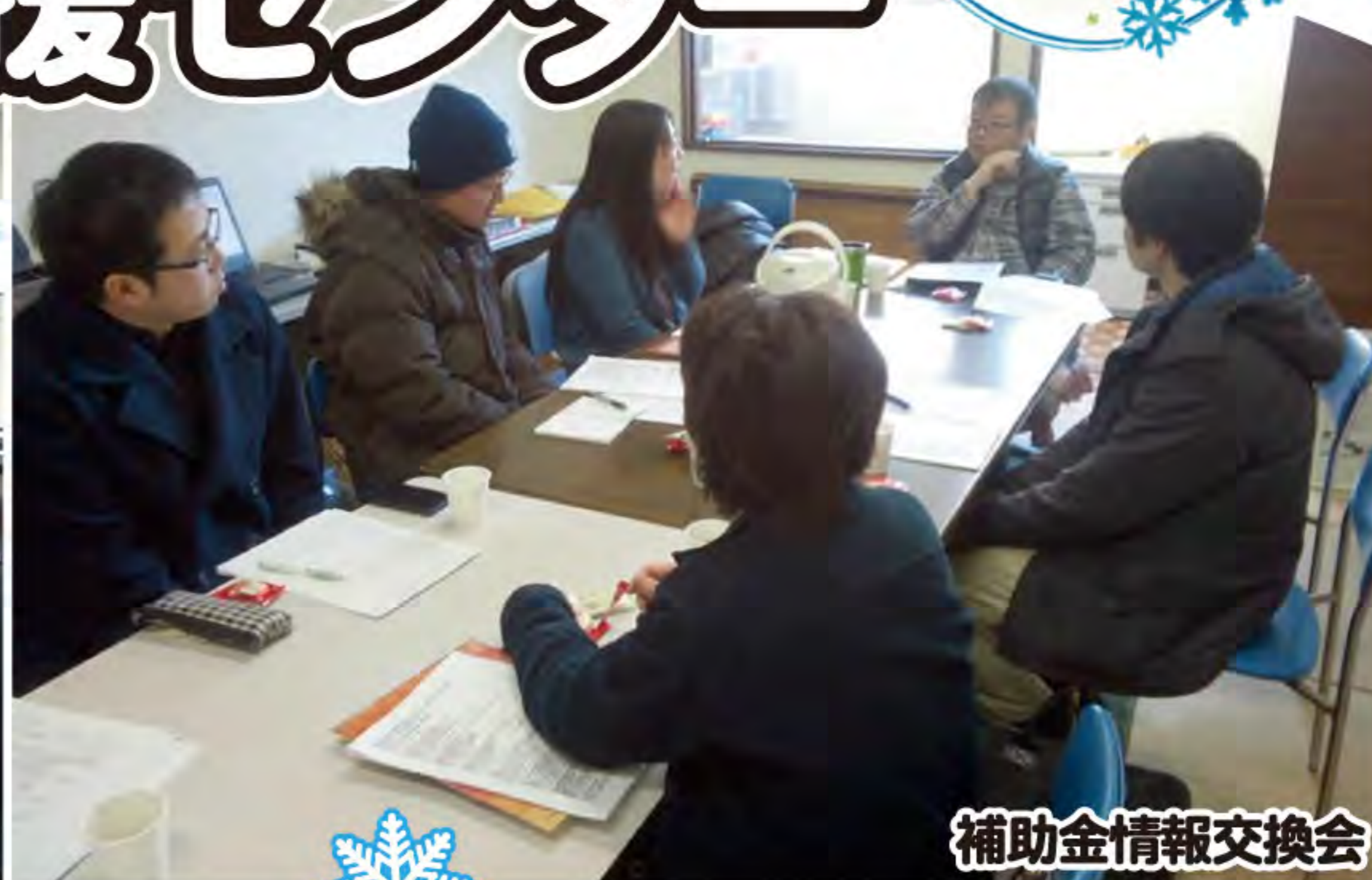
補助金情報交換会