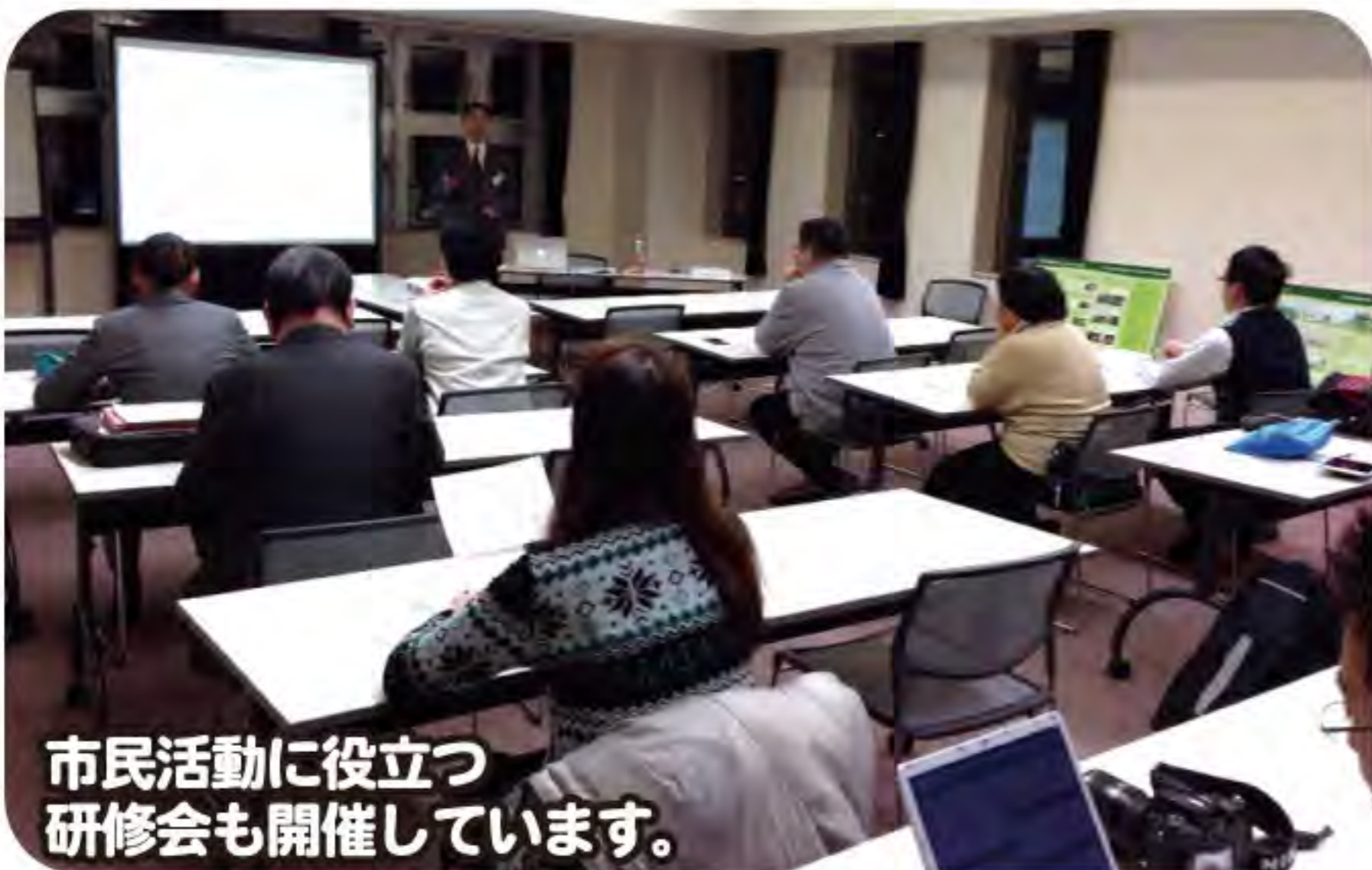
市民活動に役立つ研修会も開催しています。