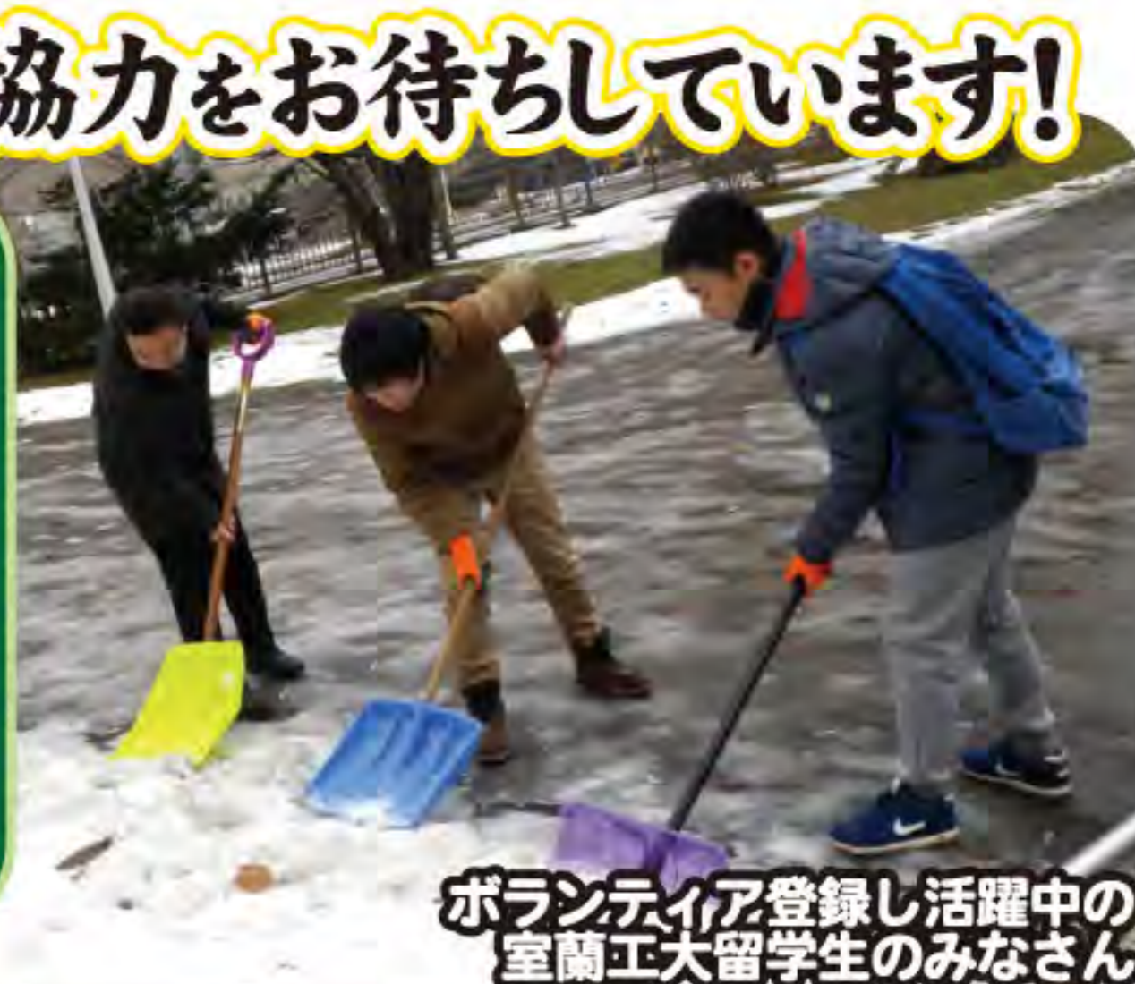
ボランティア登録し活躍中の室蘭工大留学生のみなさん

ボランティアが足りない地域は… 東・知利別・水元・港北 です! ほかの地域でも、続々と申込みが来ています! (平成30年1月15日現在)