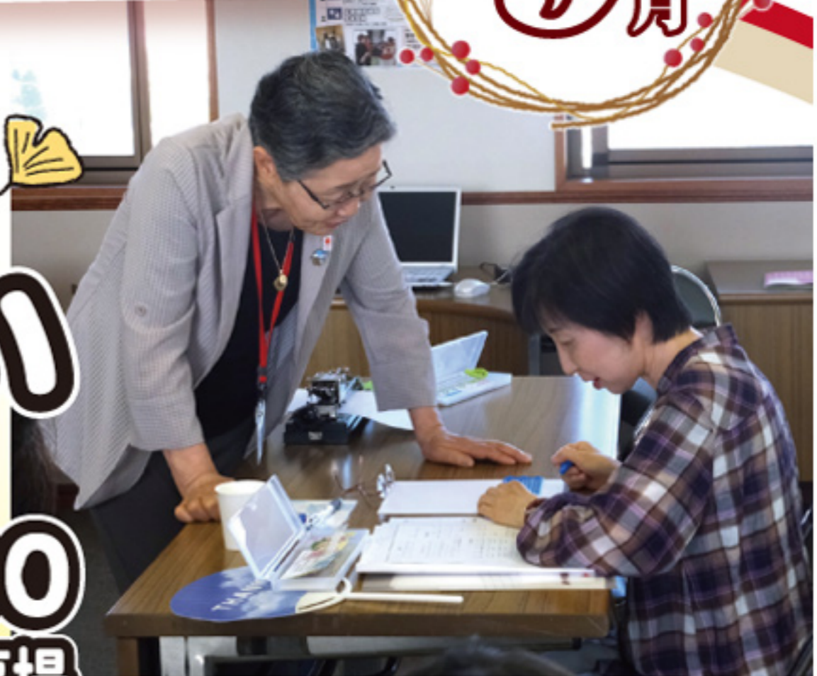
参加団体の活動の様子