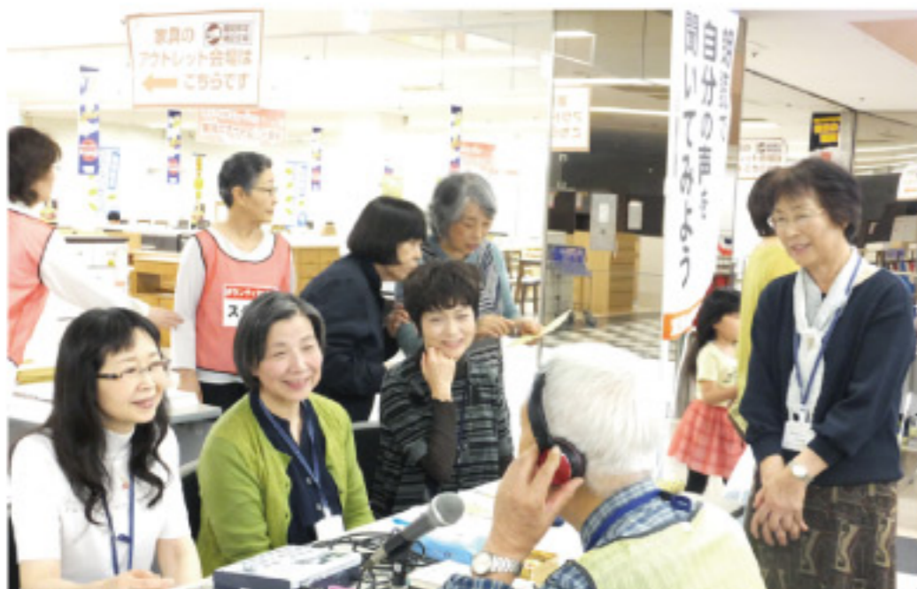
体験ブースでは、ボランティアを身近に感じてもらえる内容を企画し楽しんでいただきました。

室蘭市ボランティア連絡会では、もっとボランティア活動を知っていただくため、今回初めて周知のためのイベントを行いました。ご来場いただいた皆さん、お手伝いいただいたボランティアの皆さん、ありがとうございました。