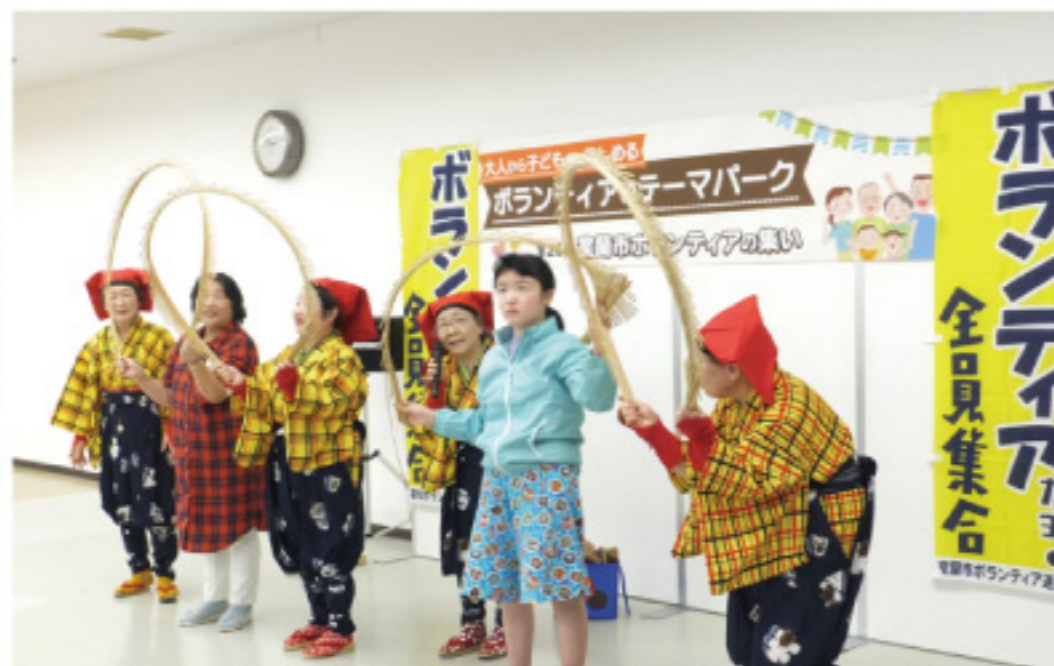
ステージでは踊りや演奏のほか、来場者の皆さんが参加する場面もありました。