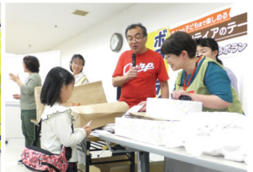
最後のお楽しみビンゴ大会も、大盛況でした。