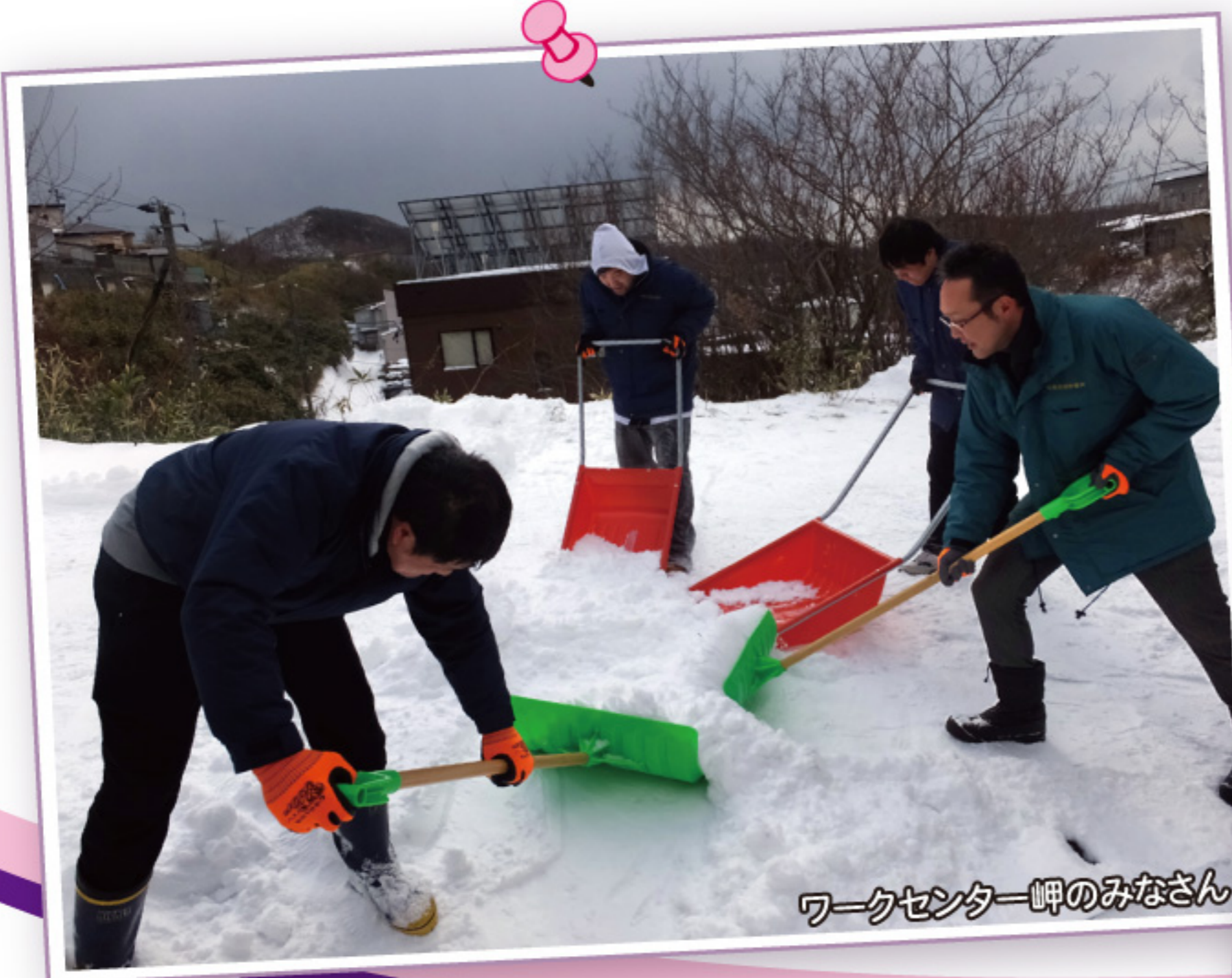
ワークセンター岬のみなさん