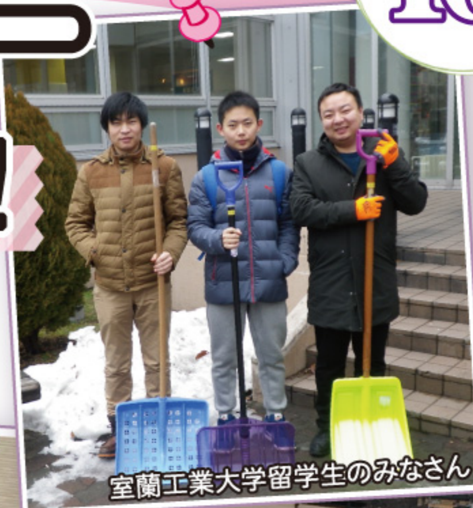
室蘭工業大学留学生のみなさん

昨年度も、たくさんのボランティアの方にご協力をいただきました。 ありがとうございました。今年もよろしくお願いいたします。