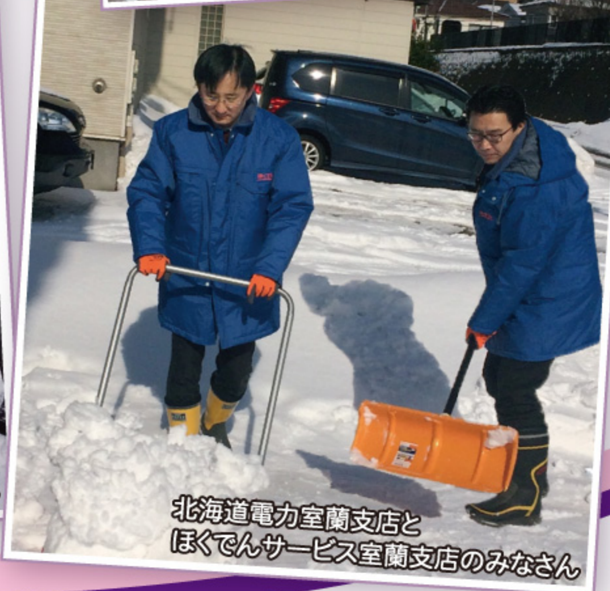
北海道電力室蘭支店と ほくでんサービス室蘭支店のみなさん