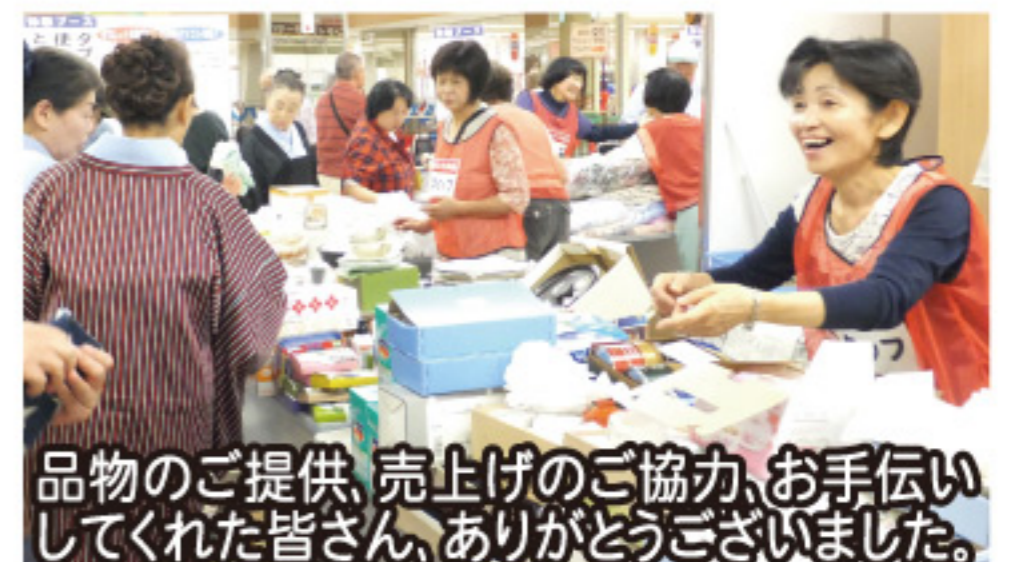
品物のご提供、売上げのご協力、お手伝いしてくれた皆さん、ありがとうございました。