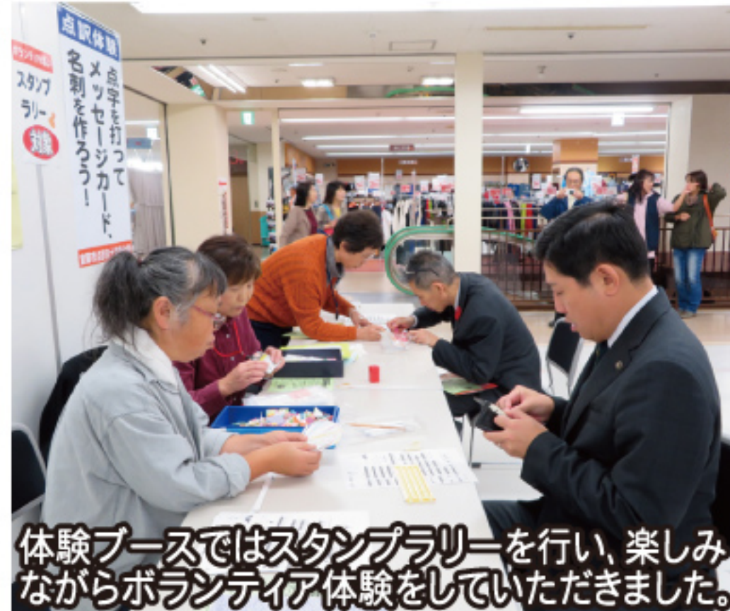
体験ブースではスタンプラリーを行い、楽しみながらボランティア体験をしていただきました。