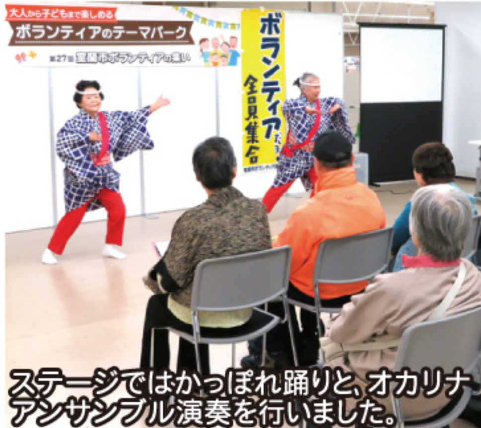
ステージではかっぽれ踊りと、オカリナアンサンブル演奏を行いました。

室蘭社協と室蘭市ボランティア連絡会では、ボランティアを知ってもらい、活動をはじめきっかけにさせていただくためのイベントを開催しました。ご来場いただいた皆さん、お手伝いの皆さん、ありがとうございました。