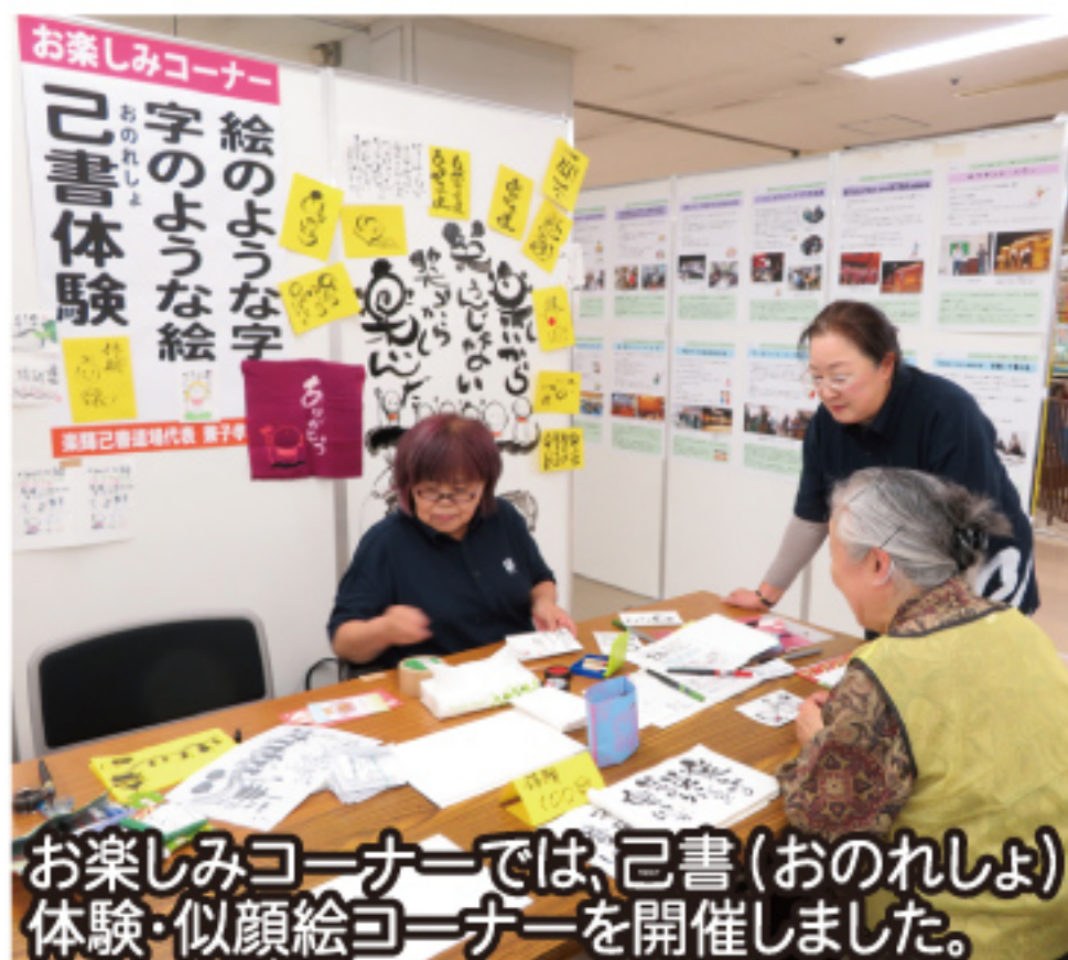
お楽しみコーナーでは、己書(おのれしよ)体験・似顔絵コーナーを開催しました。