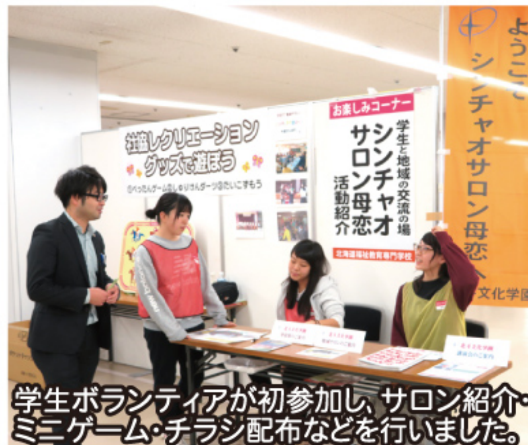
学生ボランティアが初参加し、サロン紹介・ミニゲーム・チラシ配布などを行いました。