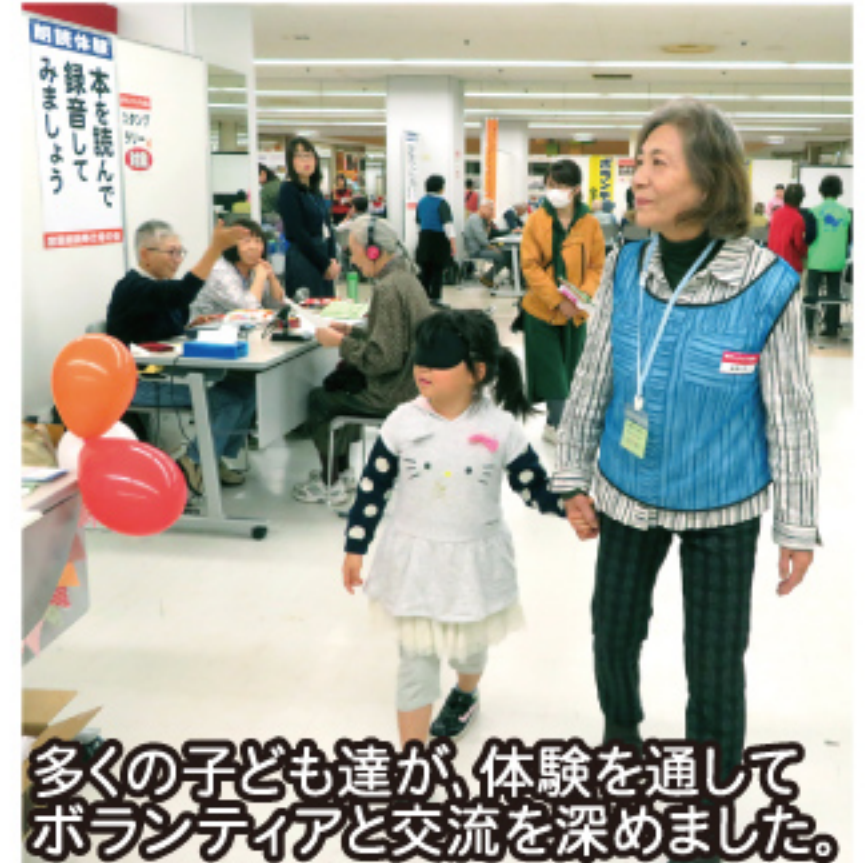
多くの子ども達が、体験を通してボランティアと交流を深めました。