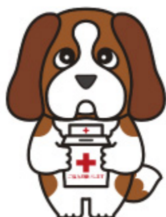
日赤北海道支部キャラクター アンリー

令和元年度室蘭市地区実績は 540万2,119円 でした。 ご協力ありがとうございました!!