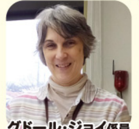
グドール・ジョイ係員

老人クラブでは、高齢者の皆さんが健康で心豊かに過ごせるよう、カラオケや季節の行事を楽しんだり、花だんづくりや募金等の奉仕活動を行い、会員同士の交流を深めています。しかし、現在は新型コロナウイルス感染症防止のため、ほとんどの活動を中止しています。そのような中、会員同士の「つながり」を保つために、工夫して活動している老人クラブがあります。その様子取材してきました!