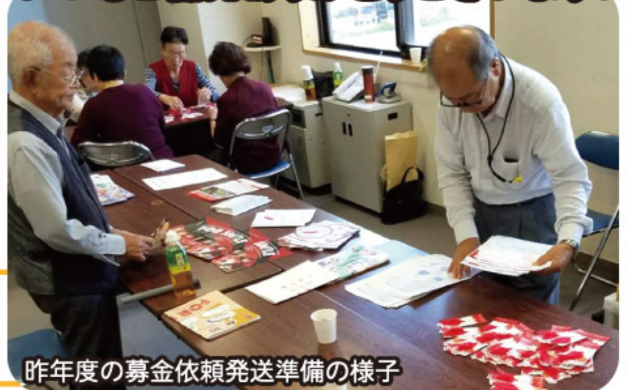
昨年度の募金依頼発送準備の様子

皆さんの善意が「地域の助けあい・支え合い」には必要です。 ご支援、ご協力をよろしくお願いいたします。