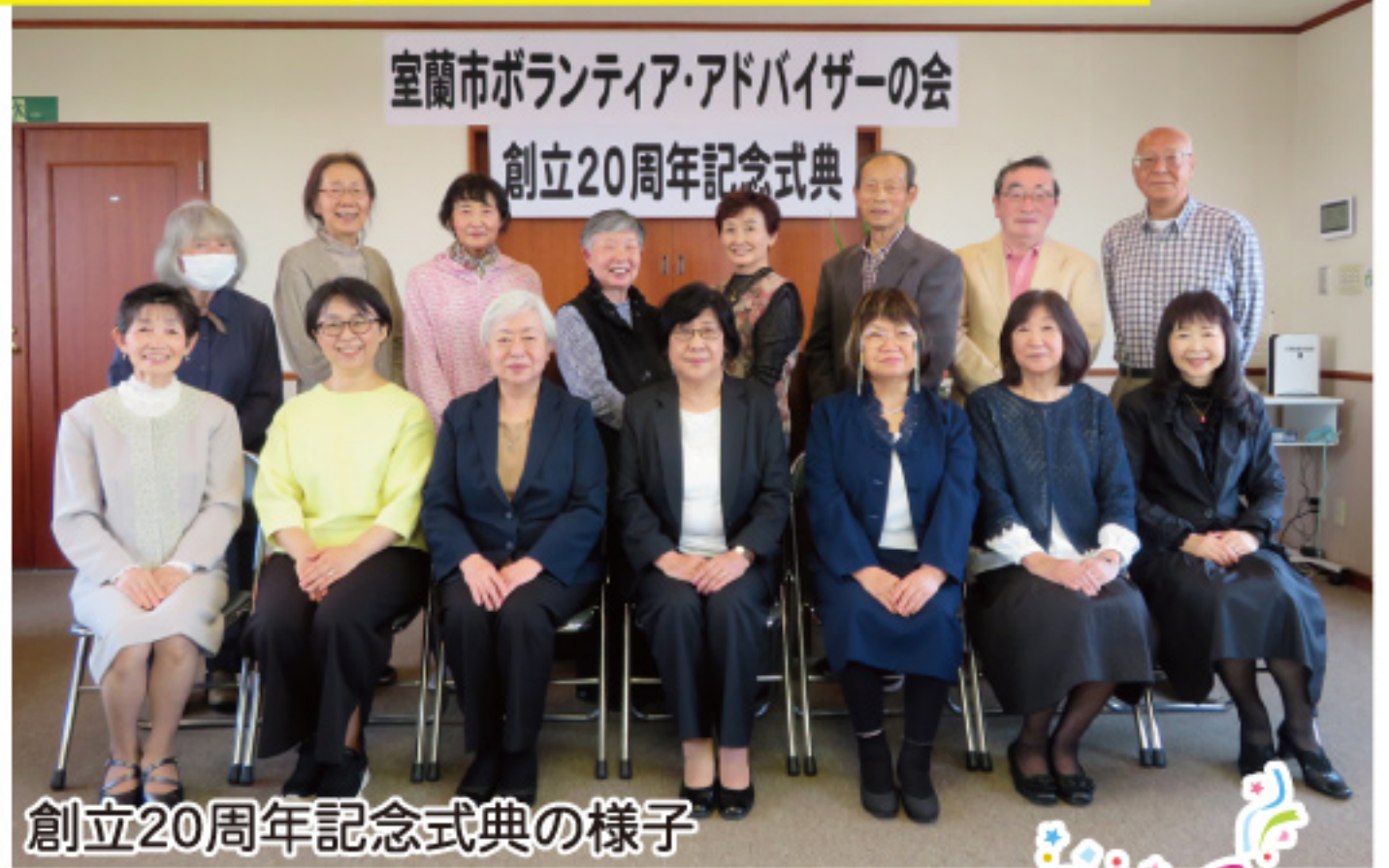
創立20周年記念式典の様子