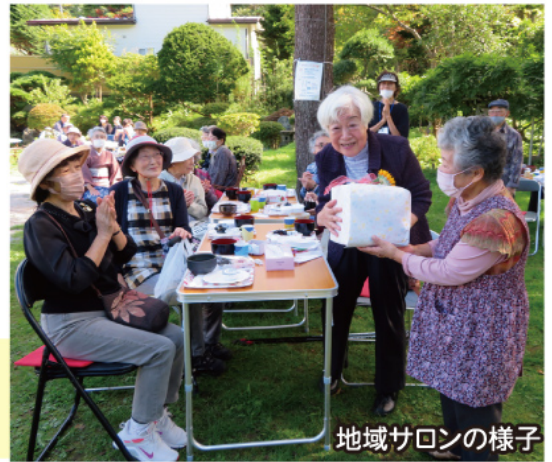
地域サロンの様子

現在、室蘭社協には市内50カ所の地域サロンが登録し、活動しています。開催場所は町会館や集会所などさまざまです。