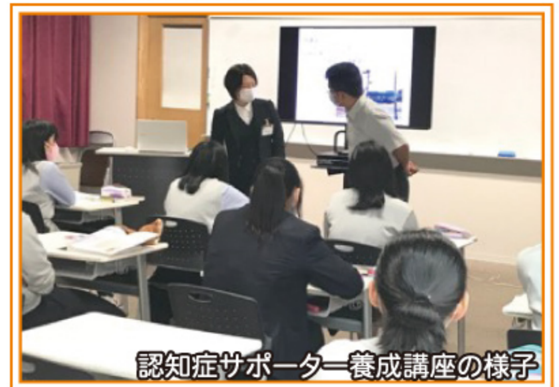
認知症サポーター養成講座の様子