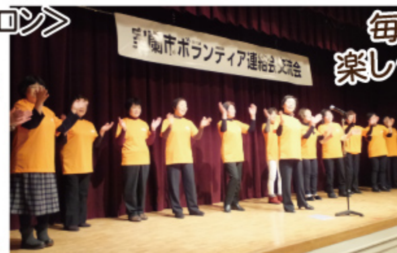
協力団体: ①手話サークル室蘭白鳥の会