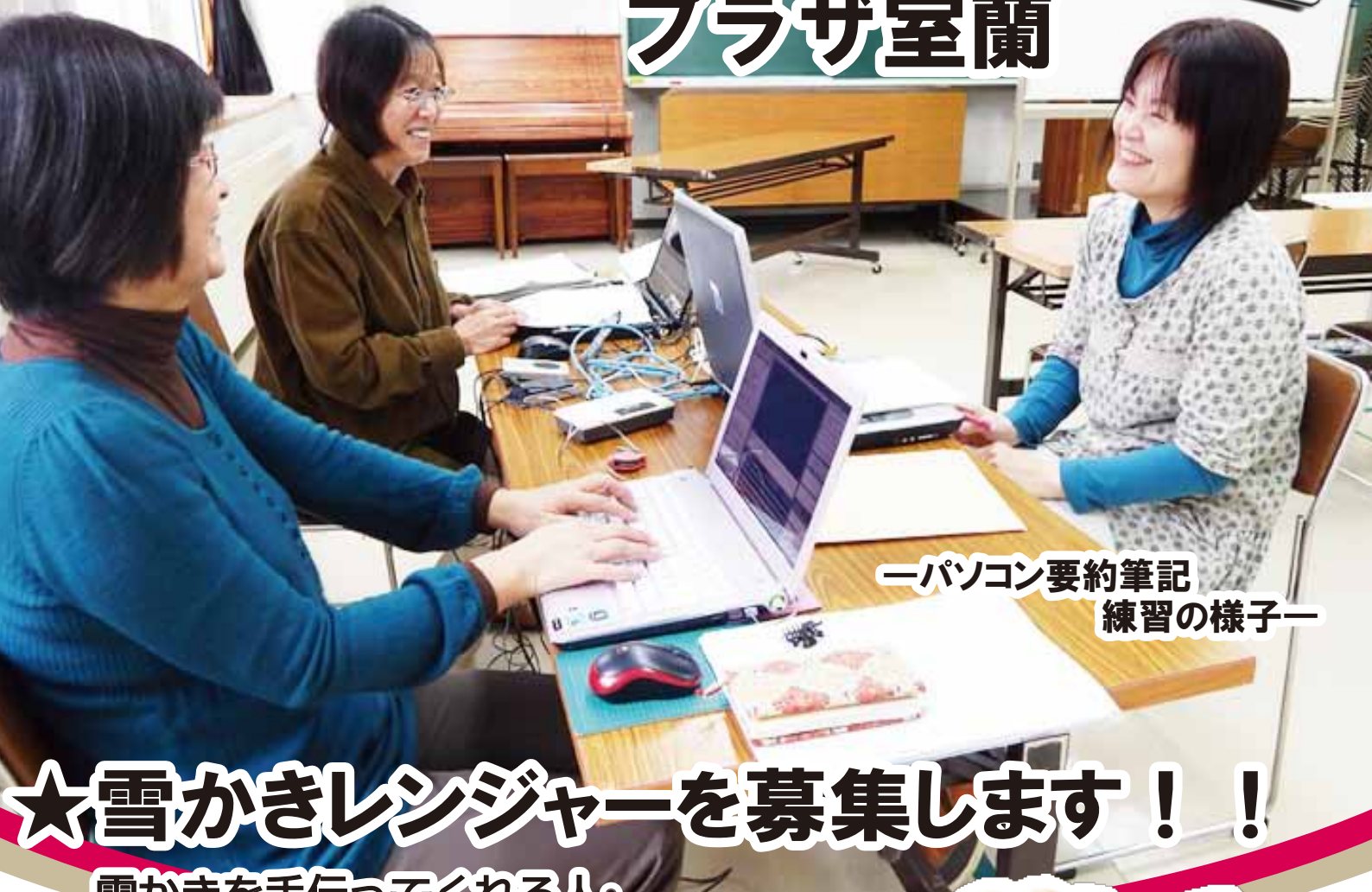
—パソコン要約筆記 練習の様子—