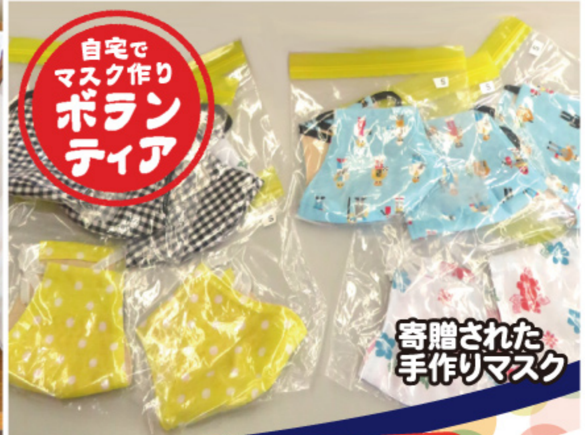
寄贈された 手作りマスク