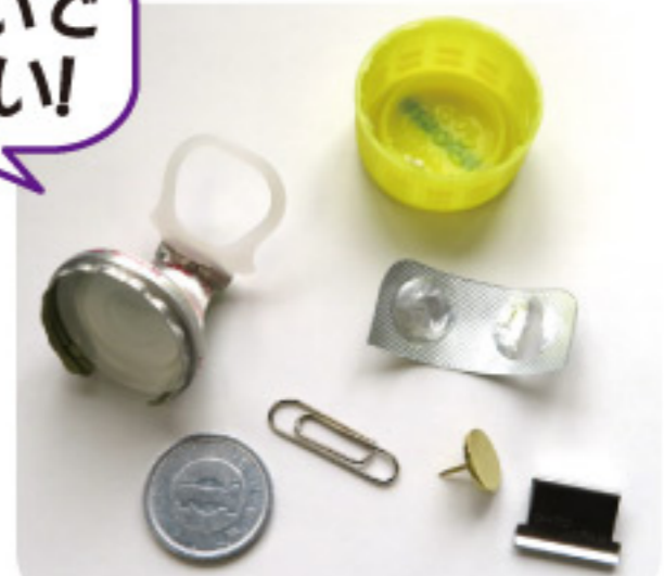
今まで入っていた物の例