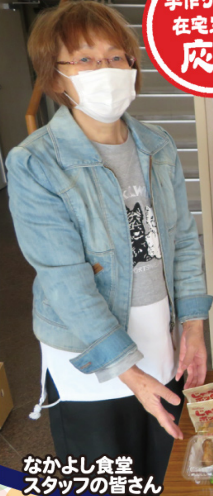
なかよし食堂 スタッフの皆さん