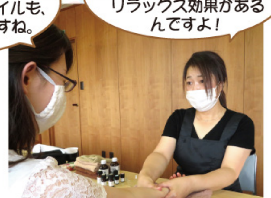
実際にマッサージをしていただきました!