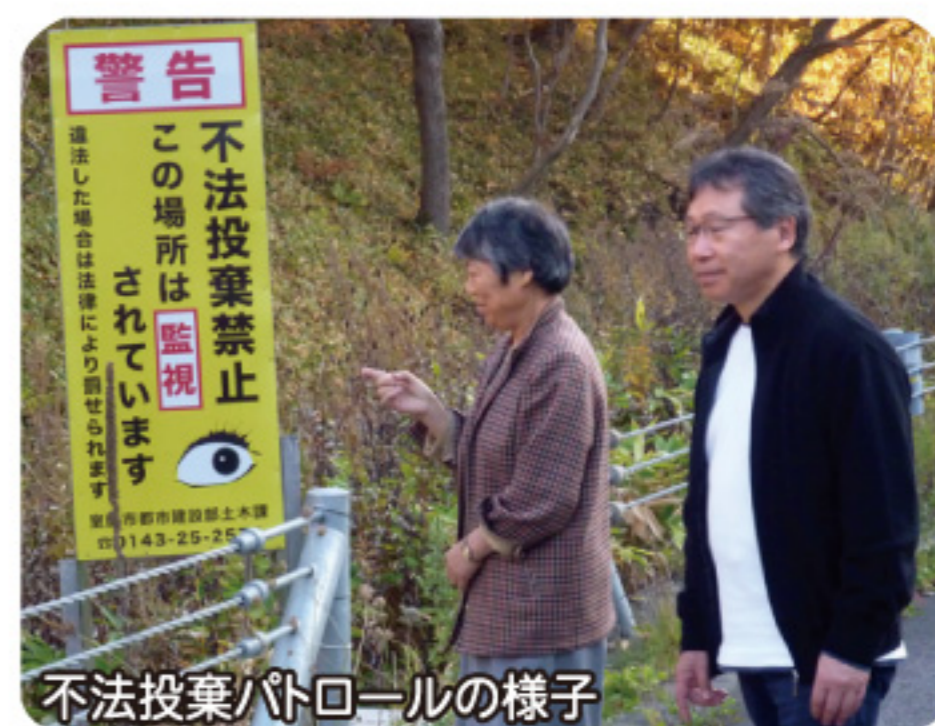
不法投棄パトロールの様子

毎年6~7月に会員をチーム分けし、市内全域の不法投棄の実態調査を行い、室蘭市に報告しています。ほか、室蘭市とのパトロール活動や、会員が住む地域のごみ拾いも行います。健康管理を兼ねて、年間50回以上ごみ拾いを行う会員もいます。古タイヤ約260トン(約26,000本)の放置を確認した時は、室蘭市に相談した結果、市の環境部門をはじめ胆振支庁(当時)の尽力により全量撤去ができました。室蘭市内では、美しい自然環境とは裏腹に、不法投棄が続いています。これからもきれいなまちづくりをめざし、活動していきたいです。