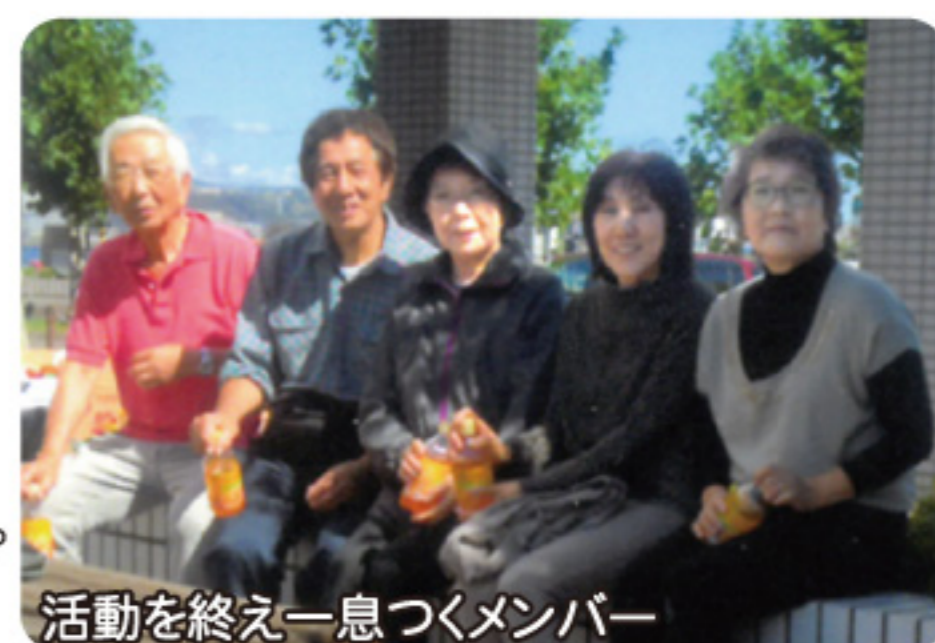
活動を終え一息つくメンバー

港立市民大学の受講生からの「講座だけでなく、まちづくり活動もやりたい」という声きっかけで、有志を募り15年前から活動しています。春から秋にかけ、毎月1回中央ふ頭周辺のごみ拾いと、スワンフェスタ開催前の草刈りをしています。仲間と楽しく交流しながら、自分自身のためにもなると思い活動を続けてきました。一人ひとりが意識を持って、ごみのないまちにしていきたいですね。