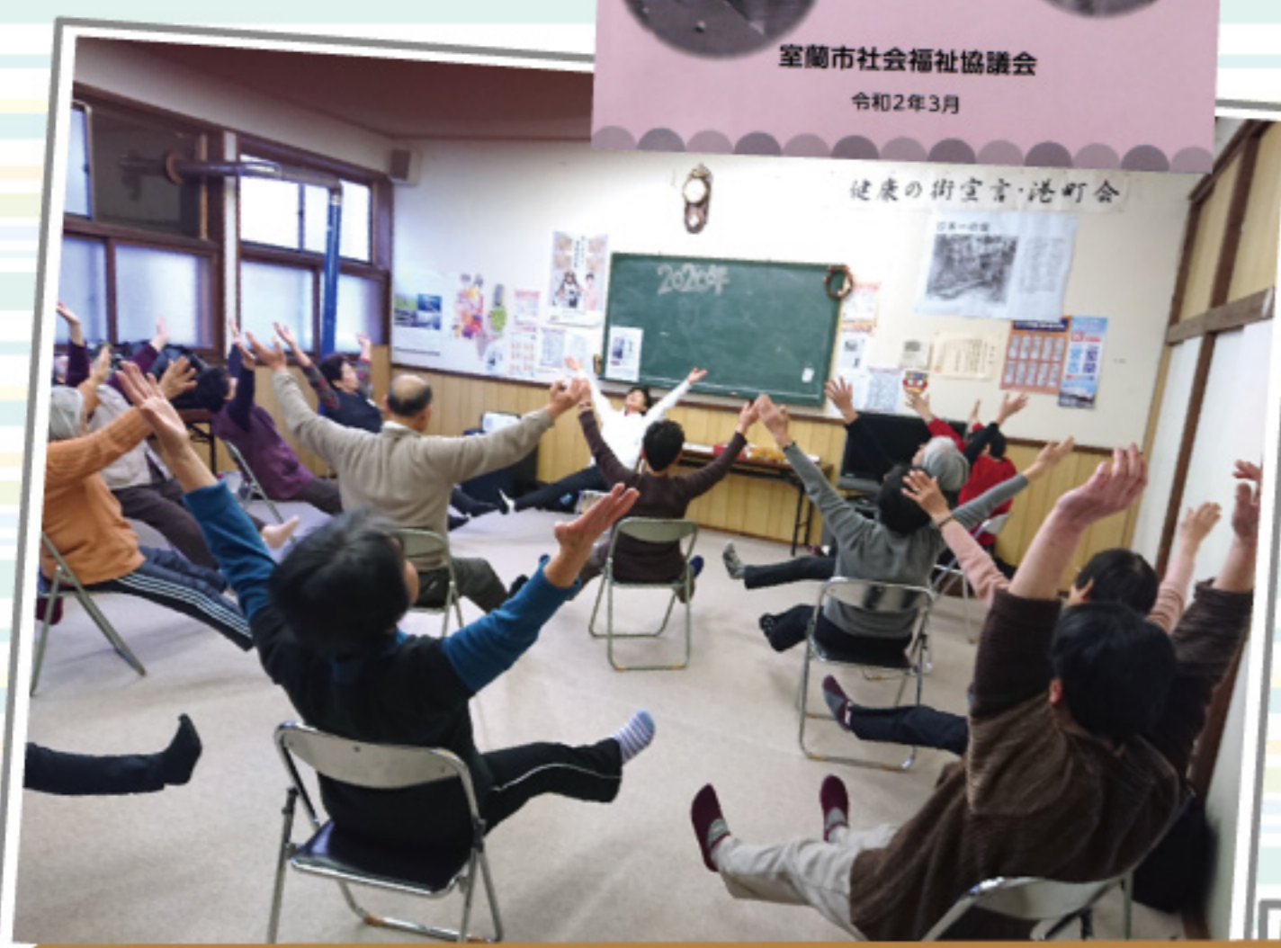
地域サロンの様子 地域サロンは、地域の方が気軽に立ち寄れる交流の場です。※7月以降随時再開予定