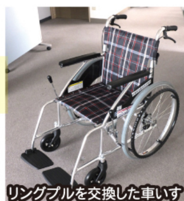
リングプルを交換した車いす

リングプルが600キロ集まると、車いす1台に交換できます。皆様のご協力により、今まで5台の車いすと交換することができました。車いすは室蘭社協で必要とする方に貸し出しています。