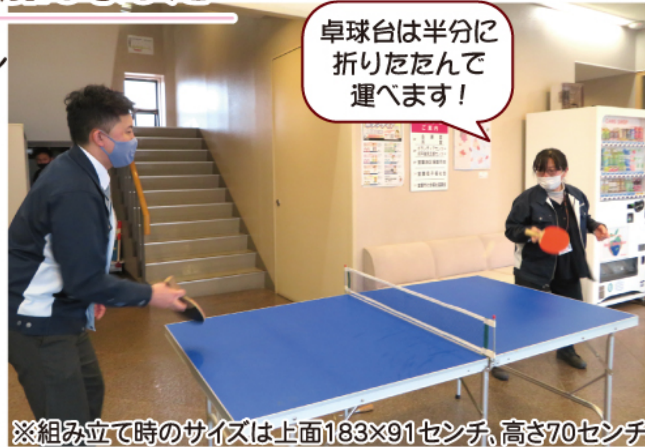
※組み立て時のサイズは上面183×91センチ、高さ70センチ