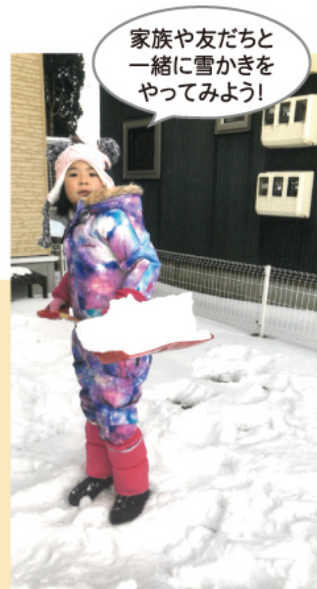
※写真は昨年度入選された皆さんです

昨年度の応募作品の一部をご紹介します。「初めて自分で雪かきをして大変さが分かった。これからはお手伝いに励みたい」「今まで雪かきをしてきていた人へ感謝の気持ちが生まれた」「家族と一緒に雪かきボランティアに登録し、人の役に立てた喜びを感じた」などの内容が寄せられ、自分の体験を振り返ることで、新しい発見やボランティアへの興味が生まれた様子が、多くの作文から読み取れました。