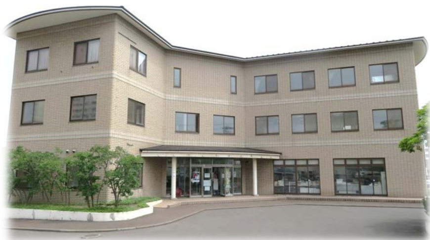
室蘭市社会福祉協議会 外観